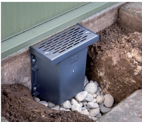
De T174-B koekoek toegepast met RVS rooster.