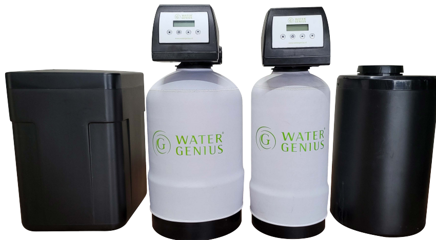
Classic G.R.E.E.N. 1400 external