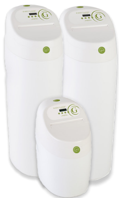
Classic G.R.E.E.N. 1400 en 850 compact