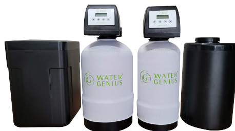
Classic G.R.E.E.N. 1400 en 850 external