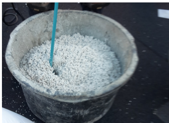
Stap 5 - Gooi het MENGSEL over in een andere kuip en meng het geheel nogmaals goed door.