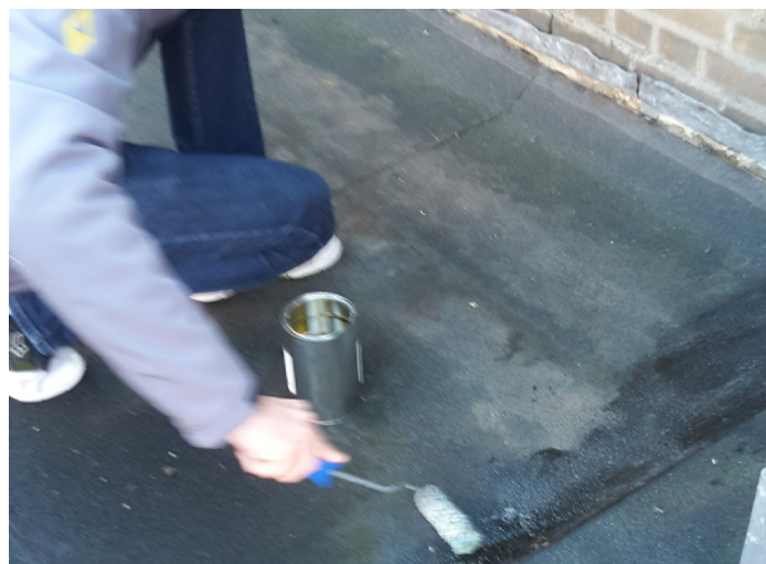
Stap 3 - Rol de EGAMORT op de ondergrond als primer bij grote vlakken en grote windbelasting.

AGS EgaMort is een lichtgewicht product dat uw dak uitvlakt en beschermt tegen invloeden van buitenaf. Het kan gebruikt worden om een dak uit te vlakken, een gedeelte op hoogte te brengen of om een dak te herstellen en om correcties van afschot te doen of het creëren van extra afschot. De uitvlakmassa bestaat uit een oplosmiddelvrije één-component polyurethaan (de binder) en glasvezelbollen.