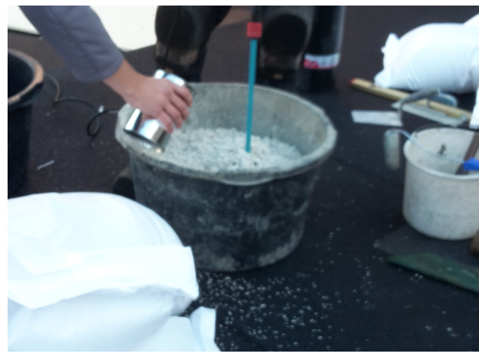
Stap 4 - Voeg de EGAMORT Harder en vervolgen ook een vol blik water al roerend toe aan de korrels.