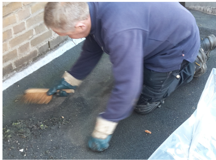
Stap 1 - Ondergrond schoonmaken