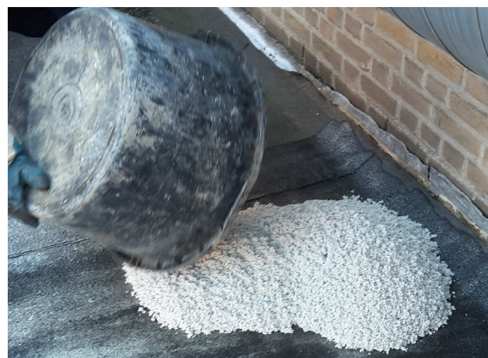
Stap 6 - Gooi het mengsel uit over het te maken oppervlak