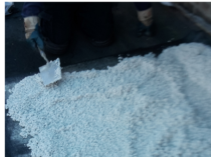
Stap 7 - Verdeel het mengsel met de spaan en breng aan op de gewenste hoogte.