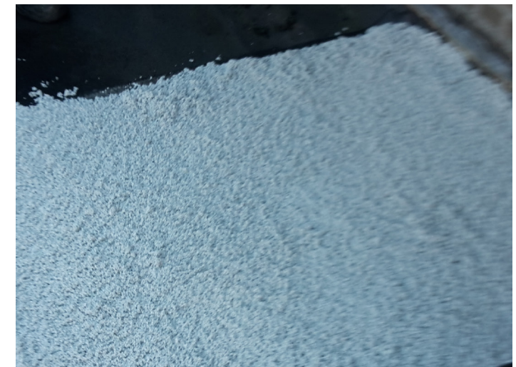
Stap 8 - De EGAMORT is aangebracht, besproei met water uit plantenspuit, laat het mengsel ca. 1 uur uitharden.