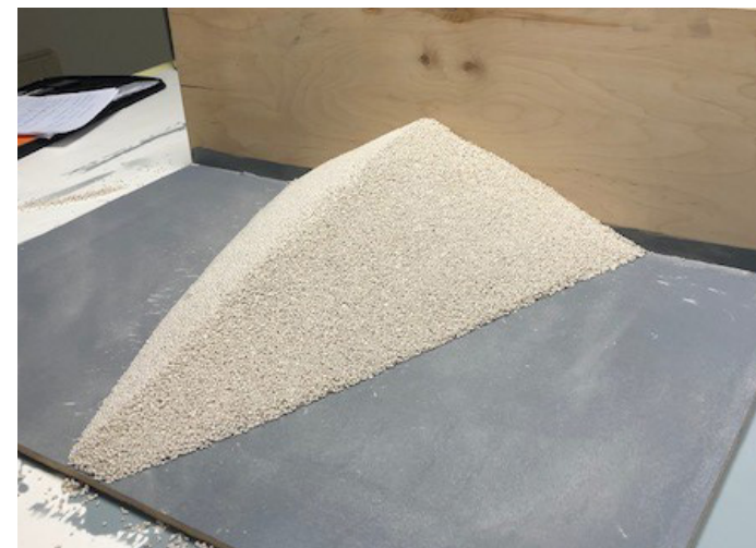
De EGAMORT is in elke gewenste vorm aan te brengen o.a. in een wig.